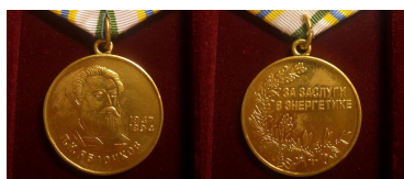
Медаль «За заслуги в энергетике»