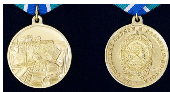
Медаль «За освоение Сибири и Дальнего Востока»