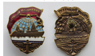
Знак «Почетный полярник» (копия)