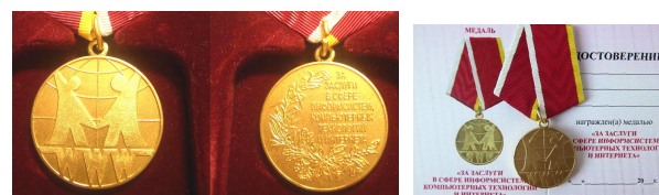
Медаль «За заслуги в сфере информсистем, компьютерных технологий и интернета»

Все медали комплектуются удостоверением, подписанным Комитетом по наградам Союзов промышленников и предпринимателей Арктической зоны РФ, футляром (велюровым или с прямоугольным ложементом прозрачным), грамотой.