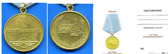
Медаль «За труд на автотранспорте»