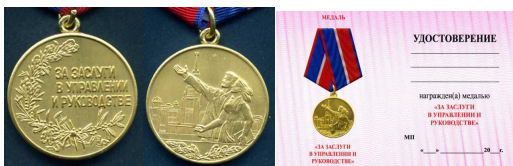
Медаль «За заслуги в управлении и руководстве»