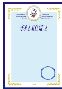
Грамота формата А4 (№4)