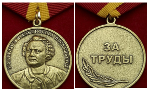
Медаль «300-летию М.В. Ломоносова посвящается. За труды»