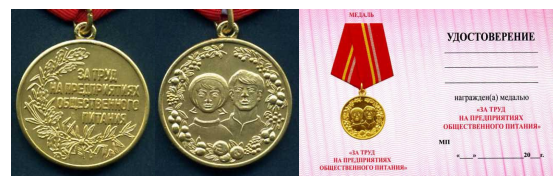
Медаль «За труд на предприятиях общественного питания»