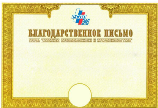
Благодарственное письмо формата А3 (№1)