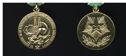
Медаль «За освоение недр и развитие нефтегазового комплекса Западной Сибири» (копия)