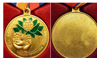
Медаль «За охрану природы России»