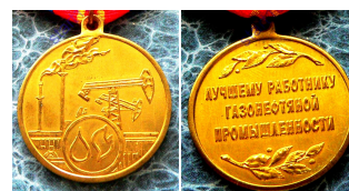
Медаль «Лучшему работнику газонефтяной промышленности»