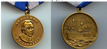
Медаль «Академик И.С.Грамберг» (нефтяная геология арктического шельфа и морей)