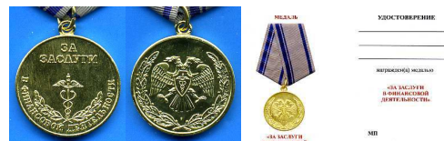
Медаль «За заслуги в финансовой деятельности»