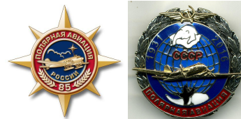
Знак «Полярная авиация, 85 лет» (вид 1 и вид 2)