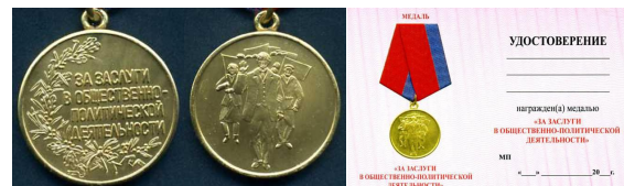
Медаль «За заслуги в общественно-политической деятельности»