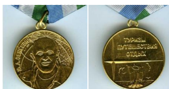
Медаль «Ю.А. Сенкевич. За заслуги. Туризм, путешествия, отдых»