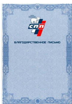
Благодарственное письмо формата А4 (№3)