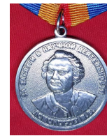
Медаль «За заслуги в научной деятельности. М.В. Ломоносов»