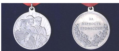
Медаль «За верность Профессии»