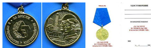
Медаль «За заслуги в строительстве и благоустройстве»