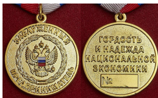
Медаль «Заслуженный предприниматель. Гордость и надежда национальной экономики»