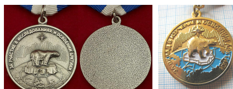
Медаль «За участие в исследованиях и освоении Арктики» / Знак «За вклад в изучение и освоение Арктики»