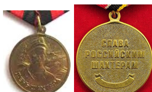
Медаль «День шахтёра»