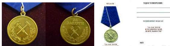
Медаль «За заслуги в технической деятельности»