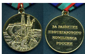
Медаль «За развитие нефтегазового комплекса России»