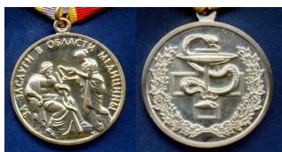
Медаль «За заслуги в области медицины»