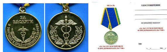
Медаль «За заслуги в торговле и предпринимательстве»