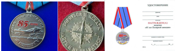
Медаль «85 лет Полярная авиация 1931-2016»