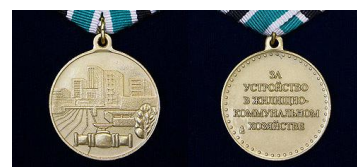
Медаль «За устройство в жилищно-коммунальном хозяйстве»